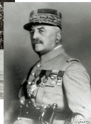
Lius Franchet d' Espérey

A bánáti 9 falu visszakerülésére nincs közvetlen utalás a szakirodalomban. Annyi közvetett információval bírunk, hogy a Bánság miatt hajba kapott két „szövetségest”, a románokat és szerbeket a franciák igyekeztek szétválasztani. Franchet d' Espérey kérte, hogy Párizsban jelöljenek ki elválasztó vonalat Arad és a Duna között a két hadsereg közé. Majd javasolta, hogy ezt az övezetet osszák három zónára, és a középsőt vegyék francia megszállás alá. Így történt, hogy a tábornok 1918. december 24-én parancsot adott a szerb egységeknek, hogy hagyják el az övezet francia szakaszát. Csakhogy a szerbek nem siettek a parancs teljesítésével, ezért a franciák katonai erővel foglaltak el néhány ellenőrző pontot a Bánátban. 16