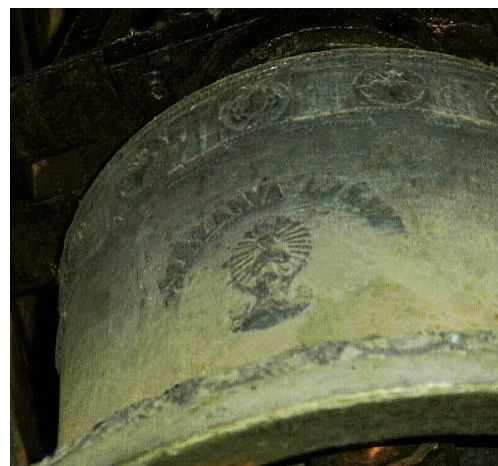
A gyálaréti harang két oldala

Számosak voltak a falu közszolgáltatásával kapcsolatos határozatok.