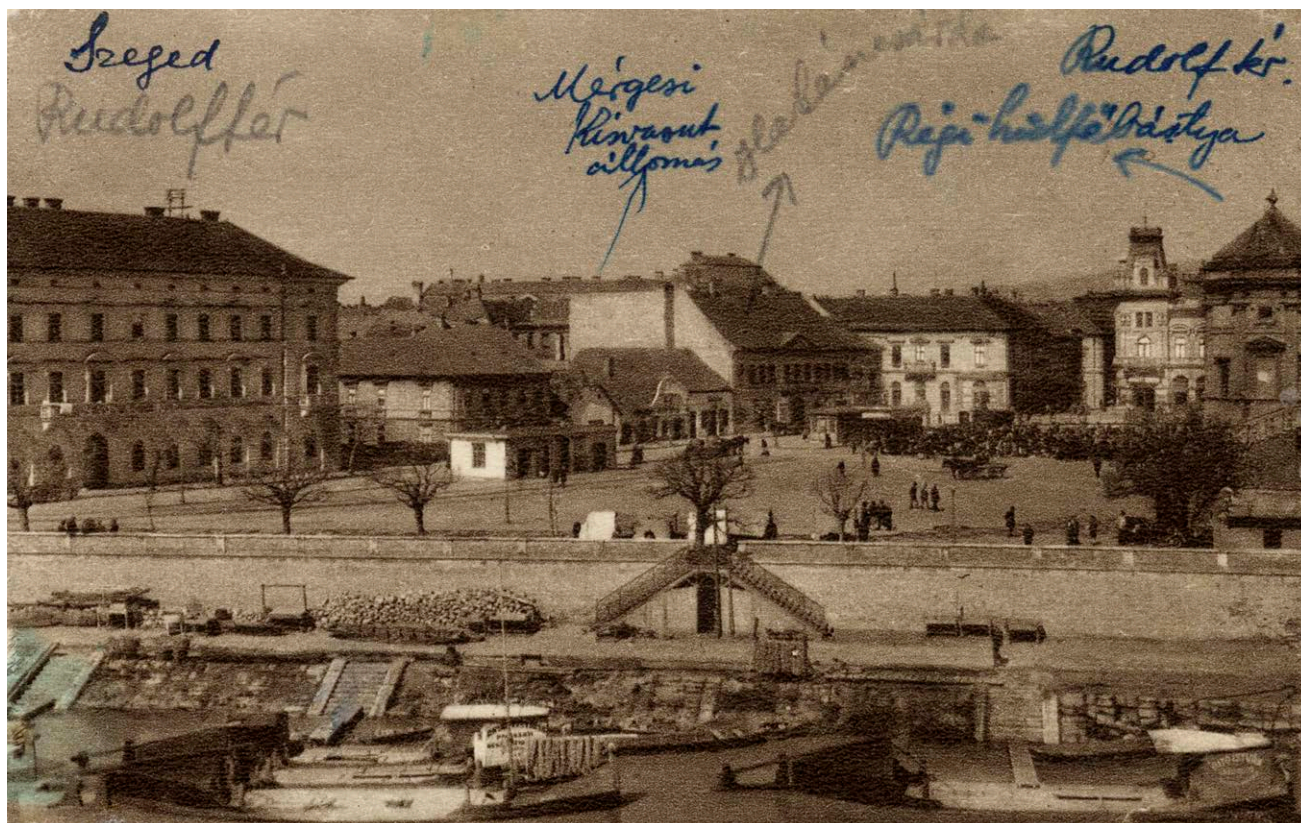
A Rudolf tér az 1920-as években

A Tisza–Maros szöget s vele Gyálát a Tisza jobb parti részével együtt 1918. november 18-án szállták meg a szerbek. A nagyhatalmi békealkudozás 1921-ben vezetett eredményre: Gyálát kettévágják, az ősi falu szerb megszállás alatt marad, külterülete, a gyálai rét viszont magyar főhatóság alatt marad. A döntés értelmében a szerbeknek 1921. augusztus 23-ig ki kellett üríteniük az elfoglalt Tisza–Maros szöget. Birtokbavételére augusztus 22-én hajnalban Szegedről indultak el a magyar katonai alakulatok. A fegyverszüneti határ ekkor a Tisza-híd közepén húzódott, Újszeged szerb területnek számított, olyanmire, hogy a Torontál téren 21-én még a szerbek járőröztek, s a Vakok Intézetébe szerb katonai és polgári funkcionáriusok fészkeltek be magukat. De augusztus 22-től minden megváltozott. Aznap éjszaka Szegeden szinte az egész város talpon volt, és várta „Újszeged felszabadulásának hajnalát” – írta az újság. 10 A háromórai harangszóra „egyszerű munkás emberek és finom úri nép, fejkendős asszonyok és cifra kalapos úri dámák sokasága sereglett a híd felé”. Mindenki látni akarta, ha csak távolból is, Újszeged felszabadítását. A Rudolf-téren katonaság táborozott, a katonák ott töltötték az éjszakát,