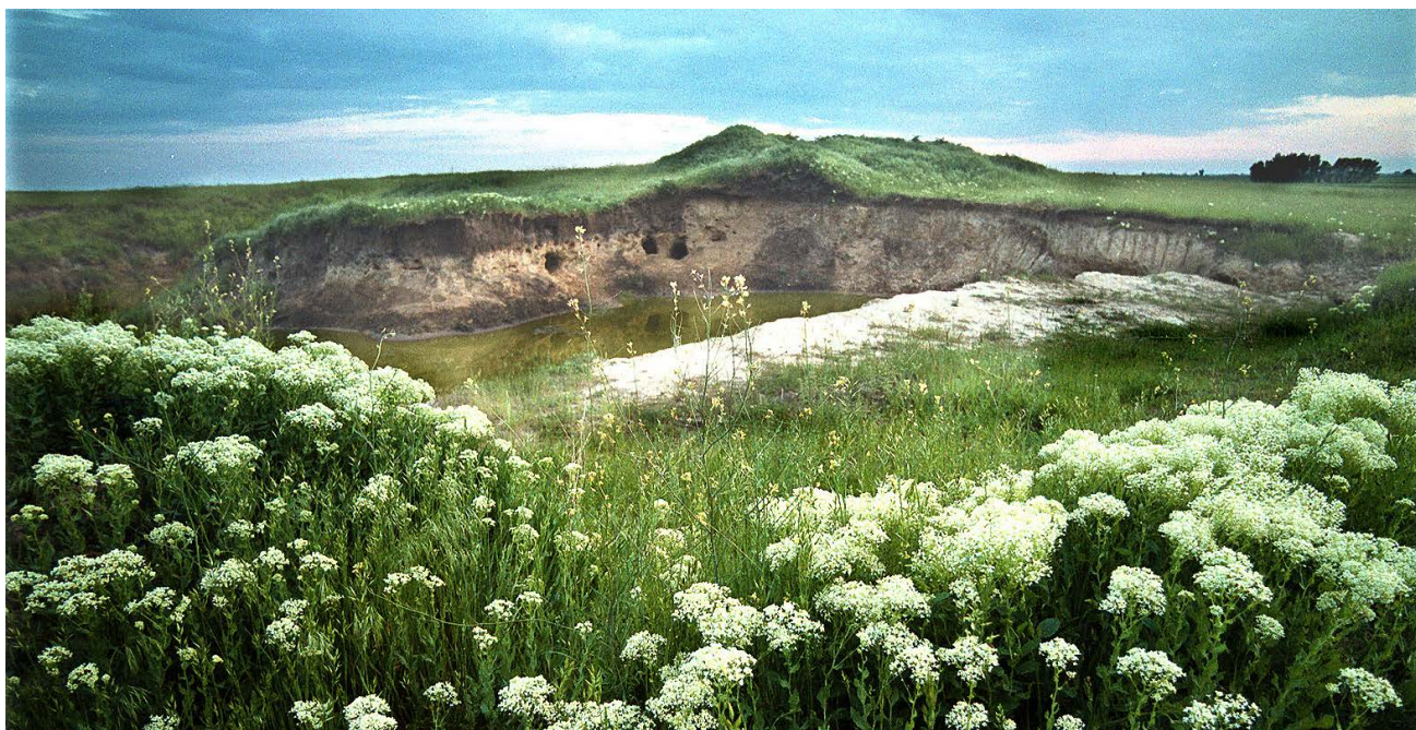
Az ásatások helyszíne a Szilágyi-majorban

Az időszak a mintegy 18 000 éve lezáródó jégkorszak gyűjtögető életmódját felváltó, másfajta világot jelentő felmelegedés kora.