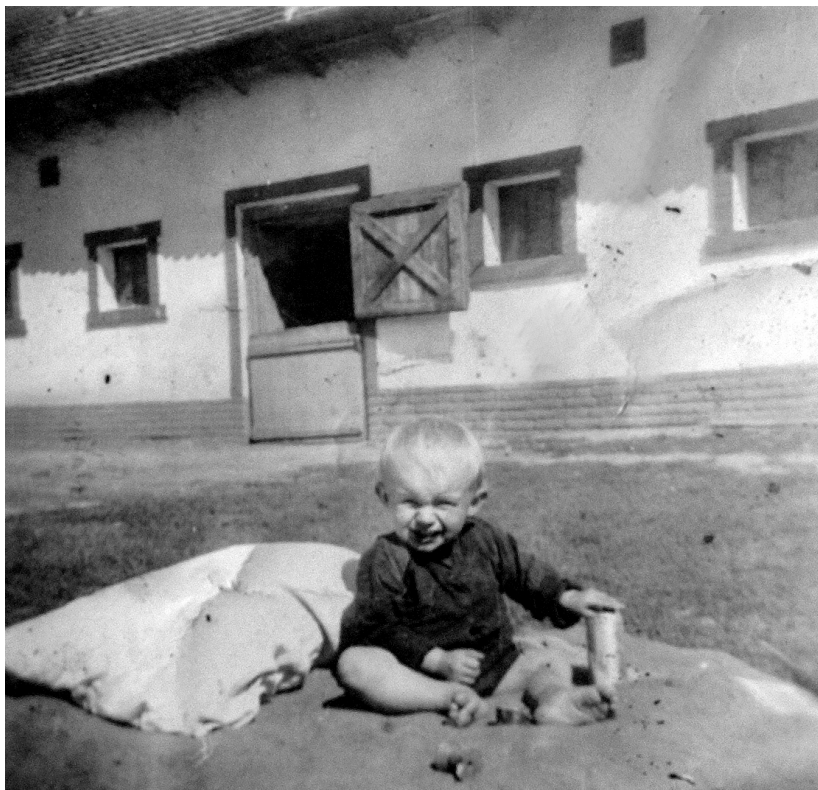
A Szilágyi-major az 1940-es években

A közgyűlési jegyzőkönyv alapján az látható, hogy a korábban juttatott föld megváltási összegének csökkentése egyfajta földteher-enyhítési állami akció volt, amelynek folyamán sor került birtokosok jogának megváltozott feltételek melletti megújítására.