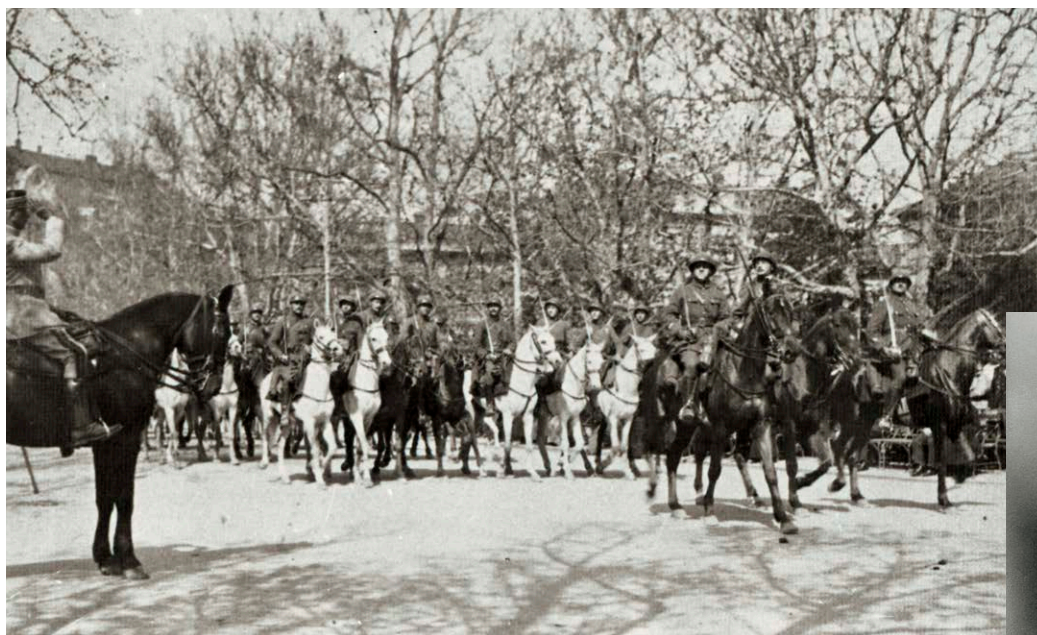
Francia katonák a Széchenyi téren

det korábbi ellátó területeitől. A franciák három nagyobb központot vettek birtokba: Aradot, Temesvárt és Szegedet. 1919. május 16-án a franciák beengedték Aradra a „kérédkedő” románokat, akik lényegében elfoglalták a várost a franciáktól. Ez fokozta az aggodalmakat Szegeden is: mi lesz, ha a franciákat a szerbek váltják föl a város megszállásában. A szerb fenyegetettségre tekintettel De Tournadre tábornok, a szegedi francia erők parancsnoka jelentette a főparancsnokságnak, hogy kívánatos a franciák Szegeden maradása. E jelentés hatására látogatott Franchet d' Espérey tábornok Szegedre, ahol 1919. szeptember 8-án a Kass-szálló halljában valóságos udvari formák között fogadta a város hatóságait, és kijelentette, hogy a franciák továbbra is maradnak, mert meg akarják kímélni a várost egy újabb megszállástól. 14 Franchet d' Espérey 1920. január 2-án tett újabb látogatást Szegeden. A városvezetőkkel folytatott újabb megbeszélései után a francia csapatok további maradását erősítette meg. 15 Szeged francia megszállása 1920. március 1-jén szűnt meg.