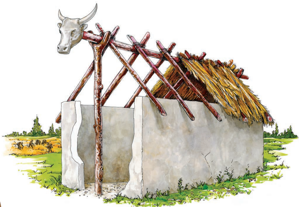
A Szilágyi-majorban feltárt újkőkori ház rekonstrukciója

E népesség kultúrája az új kőkori fejlődés élvonalában járó mezopotámiai, égei, balkáni kultúrkör legészakibb kisugárzása volt. Ezért a lúdvári leletek nemcsak helyi jelentőségűek, hanem az európai kultúra egyik legkorábbi bizonyítékai. Hasonló települések Szeged környékén Gyálarét, Röske, Deszk, Maroslele határában fordulnak elő.