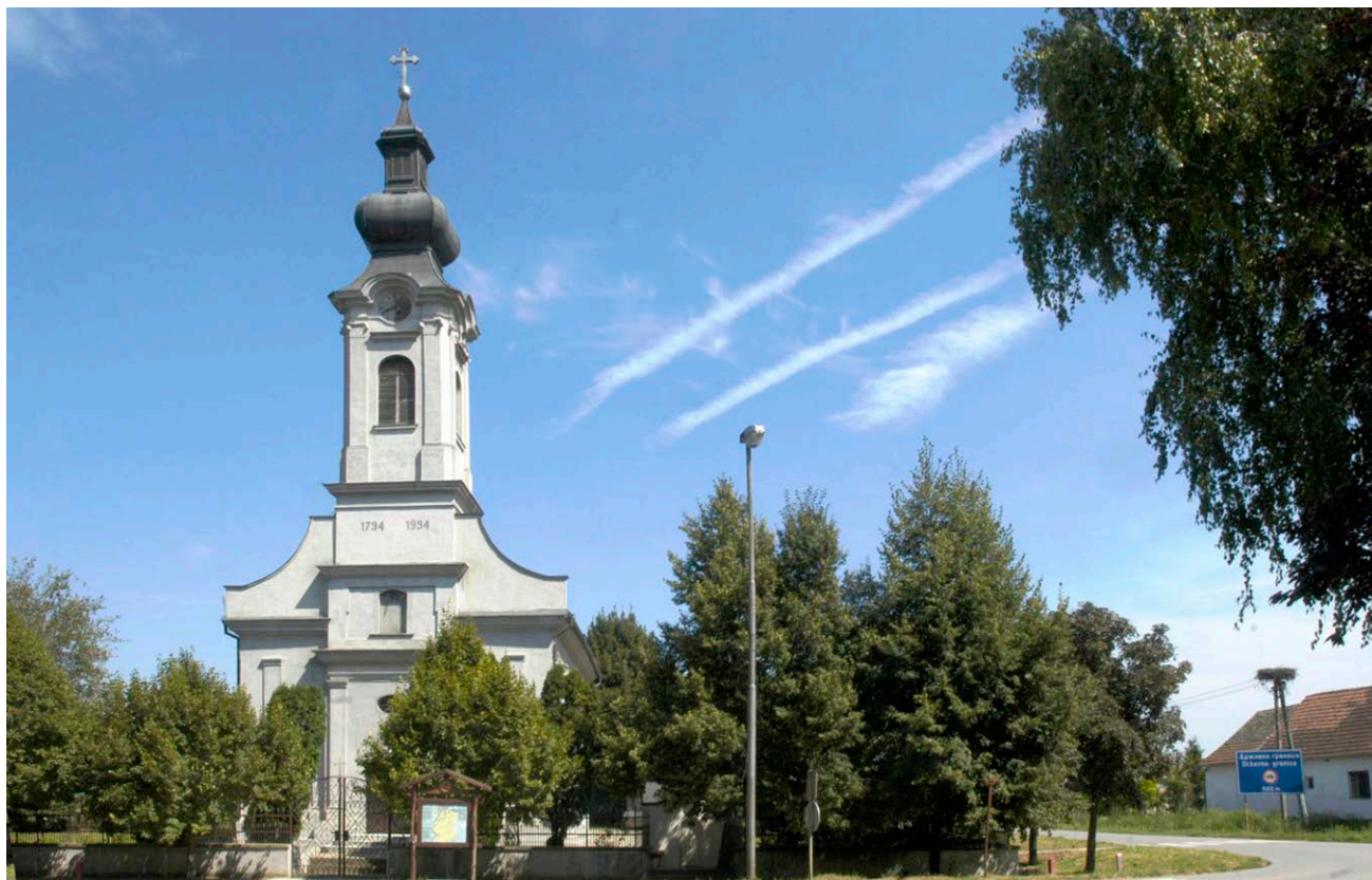
A szerbiai Gyála