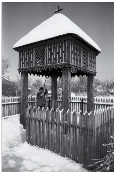
A harangláb