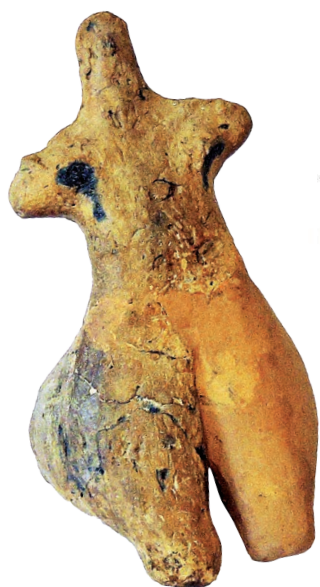
A Lúdvári Vénusz

A kor embere kiscsaládi keretekben élt, és a falu nyeregtetőű, ún. paticsfalu házaiban (agyaggal betapasztott, fonott sövényfal) lakott.