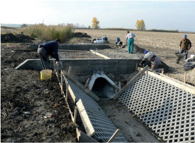
A nyári gát építése 2011-ben

A nyári árvizek arra készítették ennek a mintegy 140 holdat kitevő alsó szakasznak tulajdonosait, hogy földjeiket valamiképp megvédjék. Évekkel azelőtt az Ármentesítő Társulat VI. sz. gátórháza előtti lejáró irányában építettek egy 5,80 m korona magasságú nyári gátat, amelyet 2,00 m koronaszélesség mellett közlekedési úttal is használtak. Ez a gát a lejáró folytatásaként a hullámtéren keresztirányban haladt a part éléig, s így a teknőalakot az alsó végén bezárta. De 1925 óta azt mutatták a tapasztalatok, hogy a nem megfelelő méretekkkel kiépített töltés gyengének bizonyult. Különösen az 1932-i tavaszi és az 1933-i nyári árvíz annyira megrongálta, sőt több helyen átszakította, hogy adott állapotában semmiféle biztonságot nem nyújt, a rajta való közlekedés pedig lehetetlen. Az új terv lényege, hogy a régi harántgátat a nyári árvizek középmagasságára építik ki. Ezzel mintegy bezárják a teknő alsó végét. Felső végét a régi gátmaradvány kiegészítésével, az alsóval azonos magasságú nyúlgáttal zárják le. Ez a régi gát az ún. Szapáry-Váradai töltés, amelyet „Gyálanagyret” megvédésére építettek még a meder átvágása előtt. A töltés magasságát meghaladó tavaszi árvizek után medencében maradt Tisza-víz levezetését a folyóba az alsó gátba szerelt zsilippel oldják meg.