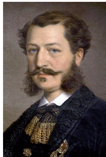
gróf Szapáry Géza