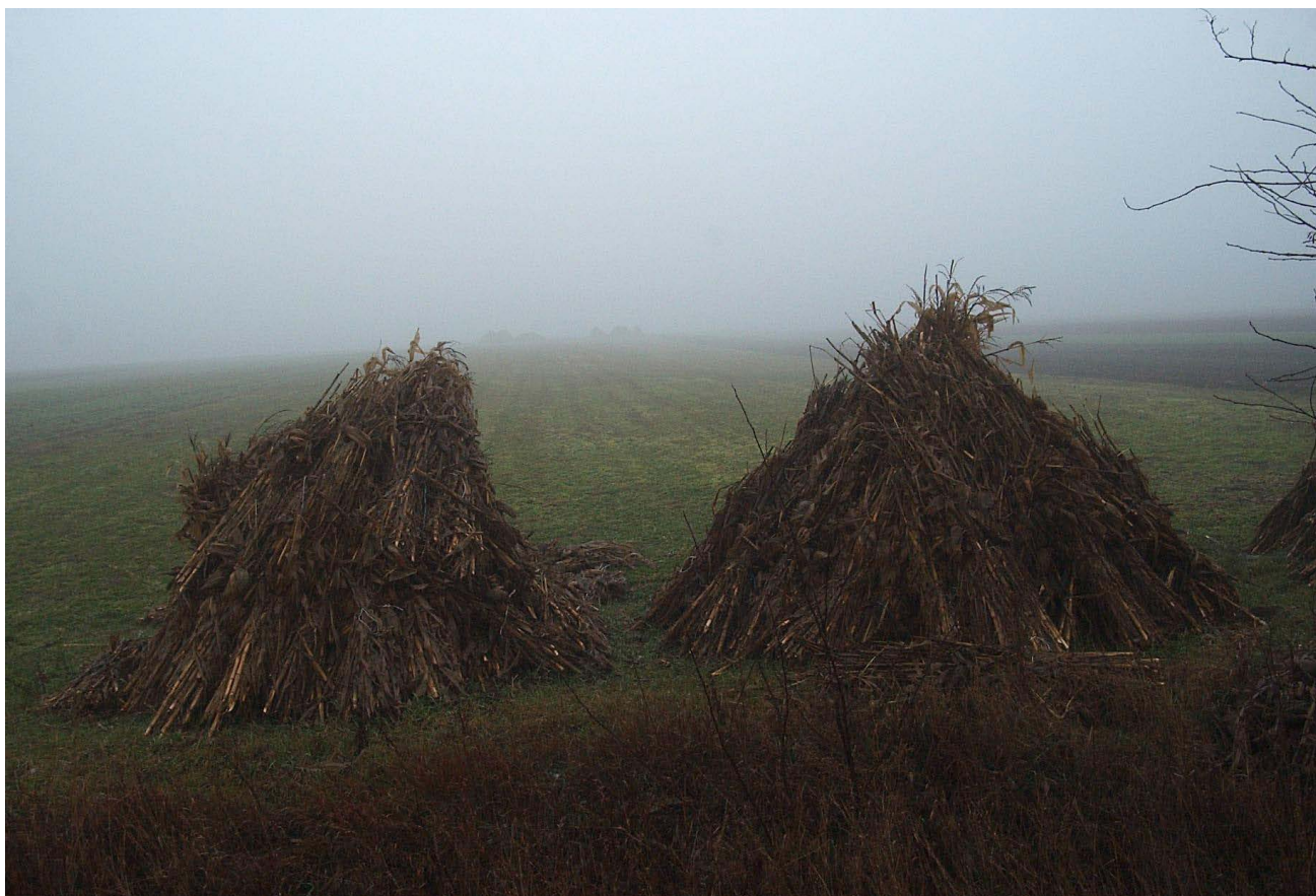
Gyálarét határában

A lábra állt és megkapaszkodott falu élettörténetén túljutottunk. Jöhet a működő, majdan komoly változásokat átélő Gyálarét kutatása, időben a '30-as évek derekától Szegedbe olvadásaig terjedően. Háborún, rendszereken átívelő periódus ez, mely további próbatételeket tartogatott a fiatal közösség számára.